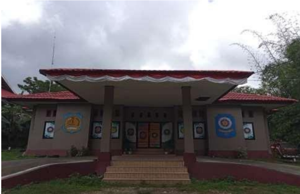
Gambar 1 Kantor Satpol PP, Damkar dan Penyelamatan

Secara Geografis Satuan Polisi Pamong Praja, Pemadam Kebakaran dan Penyelamatan Kabupaten Kepulauan Selayar terletak antara 6,12° S dan 120,47° E yang beralamat di jalan Jendral Ahmad Yani Nomor 4 Selayar. Satuan Polisi Pamong Praja, Pemadam Kebakaran dan Penyelamatan Kabupaten Kepulauan Selayar merupakan salah satu perangkat daerah di lingkungan Pemerintahan Kabupaten Kepulauan Selayar sebagai instansi mempunyai tugas membantu Bupati melaksanakan urusan pemerintahan bidang Satuan Polisi